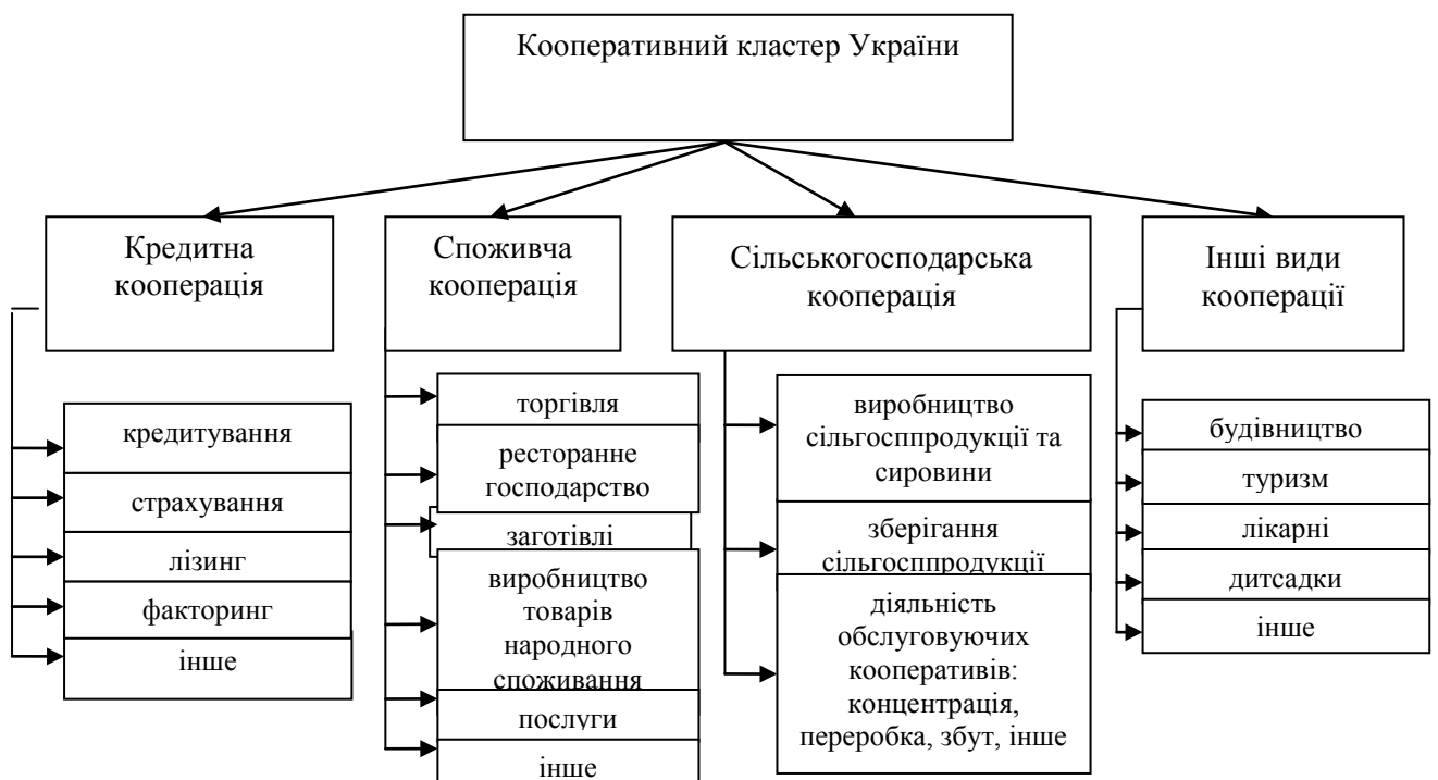
Рис. 1. Модель регіонального кооперативного кластера України

У статті аналізується можливість об'єднання трьох основних видів кооперації: споживчої, кредитної та сільськогосподарської на національному та регіональному рівнях у кластери (рис. 1).