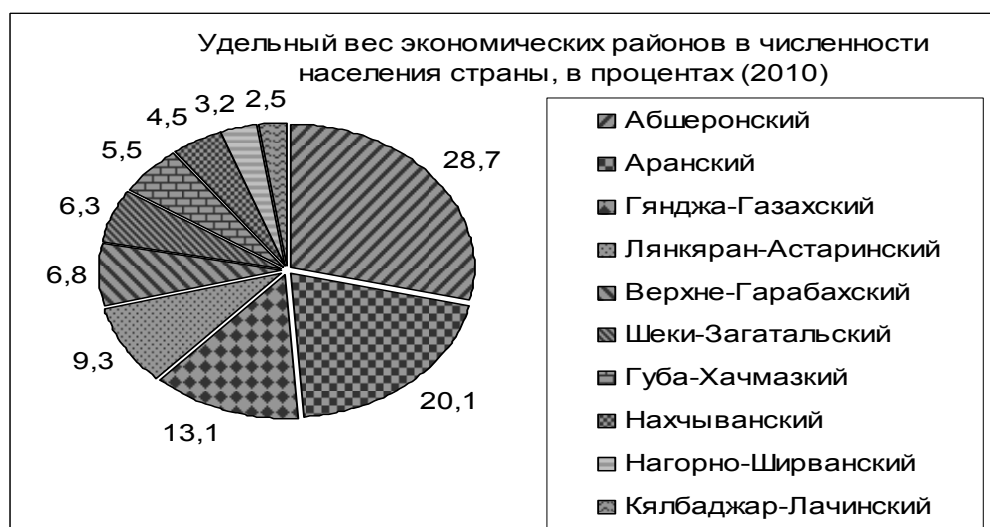
Рис. 2. Удельный вес экономических районов в численности населения страны, %

В результате миграции в 1999 г. эти показатели для русских снизились до 1,8%, для армян 1,5% (1, 50).