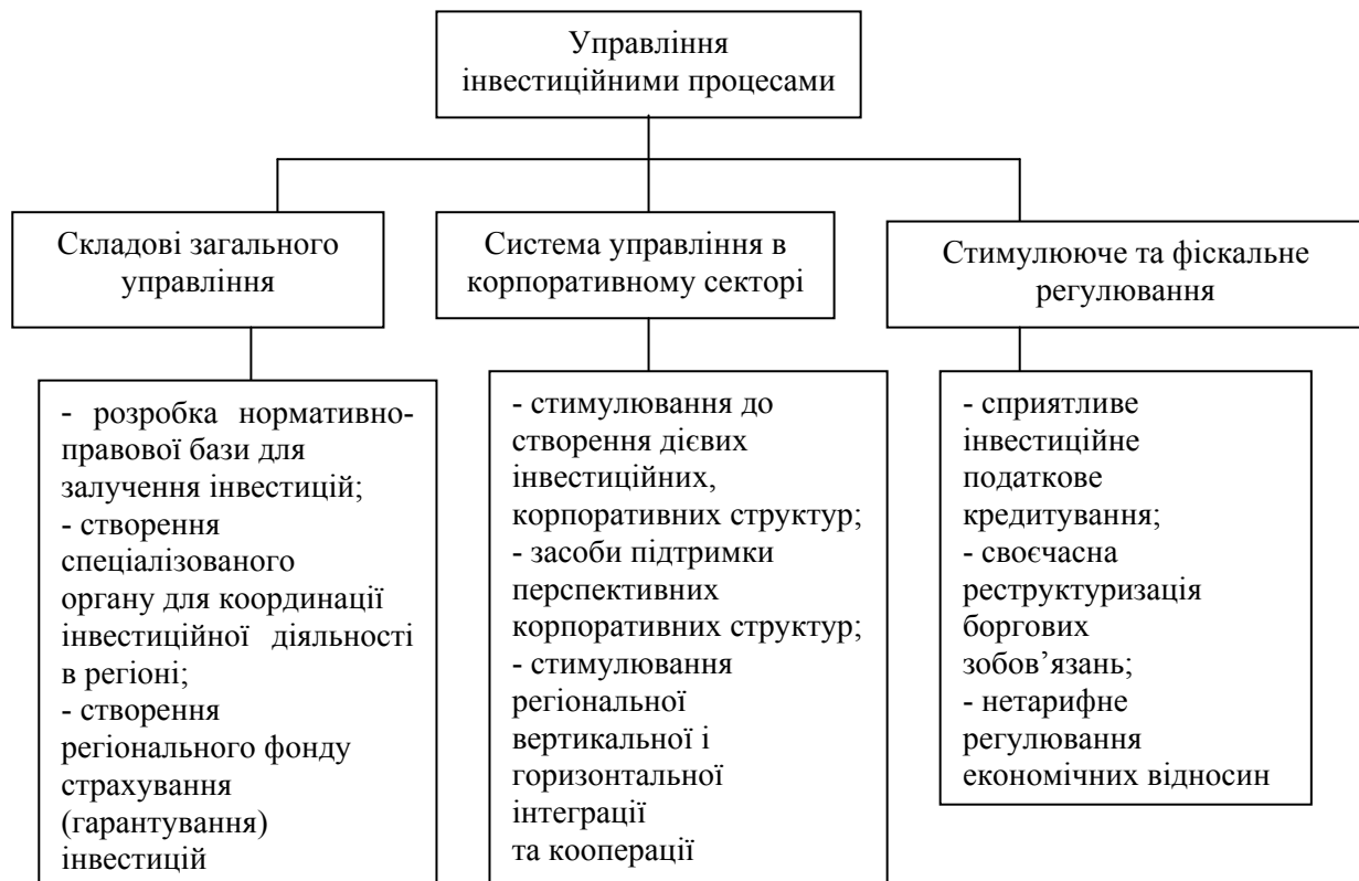
Рис. 1. Схема управління інвестиційними процесами (інвестиційною діяльністю) на рівні регіону

Таким чином, на законодавчому рівні уряд повинен гарантувати законодавчо-правовий захист інтересів інвесторів, розвиток сприятливої інфраструктури, мобілізацію ресурсів, що дозволяло б агропробудничим підприємствам підвищити інвестиційну привабливість і здійснити комплекс перетворень для ефективної діяльності. Також одною з важливих умов розвитку інвестиційних процесів в аграрному комплексі країни є проведення кваліфікованої оцінки інвестиційної привабливості, пріоритетності галузі серед інших у залученні інвестиційного капіталу, формулювання системи основних показників, що впливають на збільшення притоку капіталу.