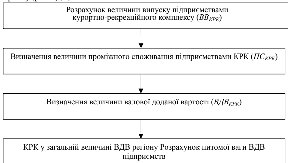
Рис. 2. Алгоритм розрахунку ВДВ на підприємствах курортно-рекреаційного комплексу

Розрахунок валової доданої вартості, утвореної на підприємствах КРК, доцільно здійснювати, дотримуючись алгоритму (рис. 2) [5]: