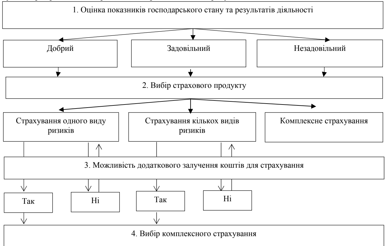
Рис. 2. Алгоритм вибору страхового продукту для підприємств агровиробників [розроблено автором]

взаємодії аграрних підприємств з такими елементами інфраструктури агропродовольчого ринку, як служби сертифікації, стандартизації, контролю за якістю продукції.