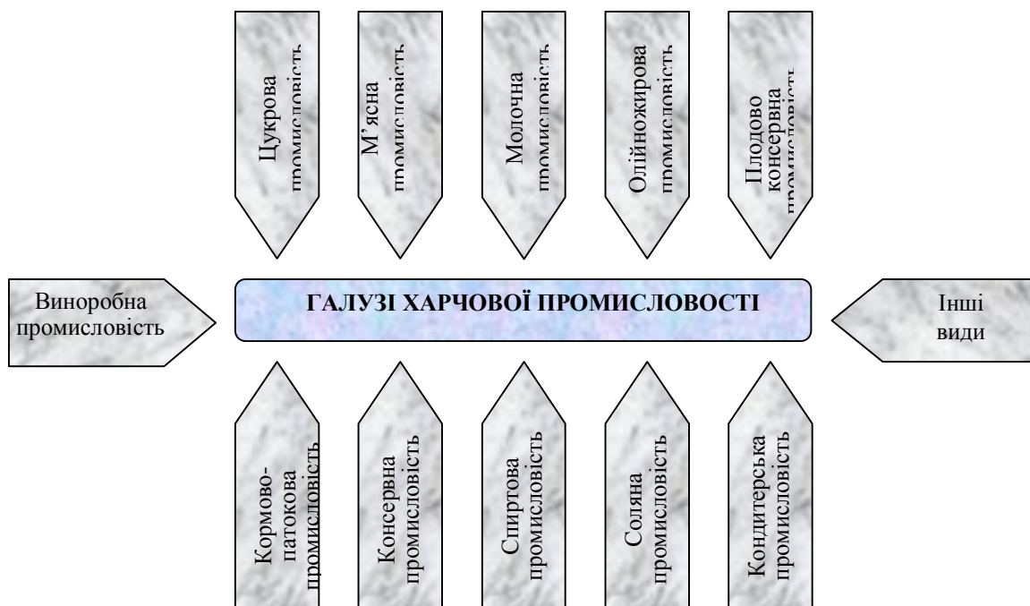
Рис. 1. Галузі харчової промисловості

Ця група представлена хлібопекарською, кондитерською, макаронною, пивоварною, молочною галузями. Галузі з одночасною орієнтацією на сировину і споживача (при більшій масі сировини порівняно з готовою продукцією) – це борошномельно-круп'яна, м'ясна, виноробна, тютюнова, лікеро-горілчана [7]. На нашу думку, провідними галузями харчової промисловості є 12 галузей (рис. 1):