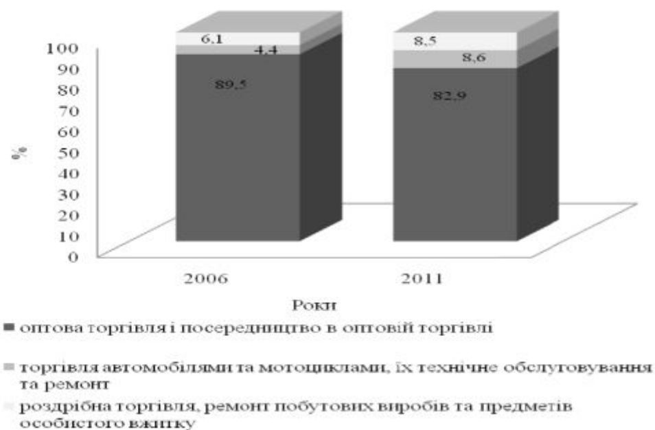
Рис. 1. Частка різних видів торговельної діяльності у формуванні активів внутрішньої торгівлі України, на початок року [2]

По друге, протягом останніх років спостерігається зростання кількості крупноформатних роздрібних підприємств. Фактично за останні шість років обсяги активів підприємств з торгівлі та ремонту транспортних засобів зросли майже у 6 разів, а з торгівлі побутовими товарами – більш, ніж у 4 рази [2].