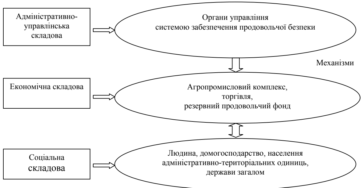
Рис. 1. Складові структури системи забезпечення продовольчої безпеки

більшості наукових праць відсутня конкретизація адміністративно-управлінської складової на регіональному рівні, здебільшого в них включено управління місцевих державних адміністрацій в сфері АПК та забезпечення продовольством [7, с. 160-161]. Між тим, особливістю структурних складових системи забезпечення продовольчої безпеки промислових регіонів є необхідність у наявності розвинутої галузі торгівлі, і перш за все оптової, з налагодженими зв'язками для здійснення міжрегіональних постачань продовольства, в обсягах, що доповнюють недостатнє їх виробництво регіональним АПК.