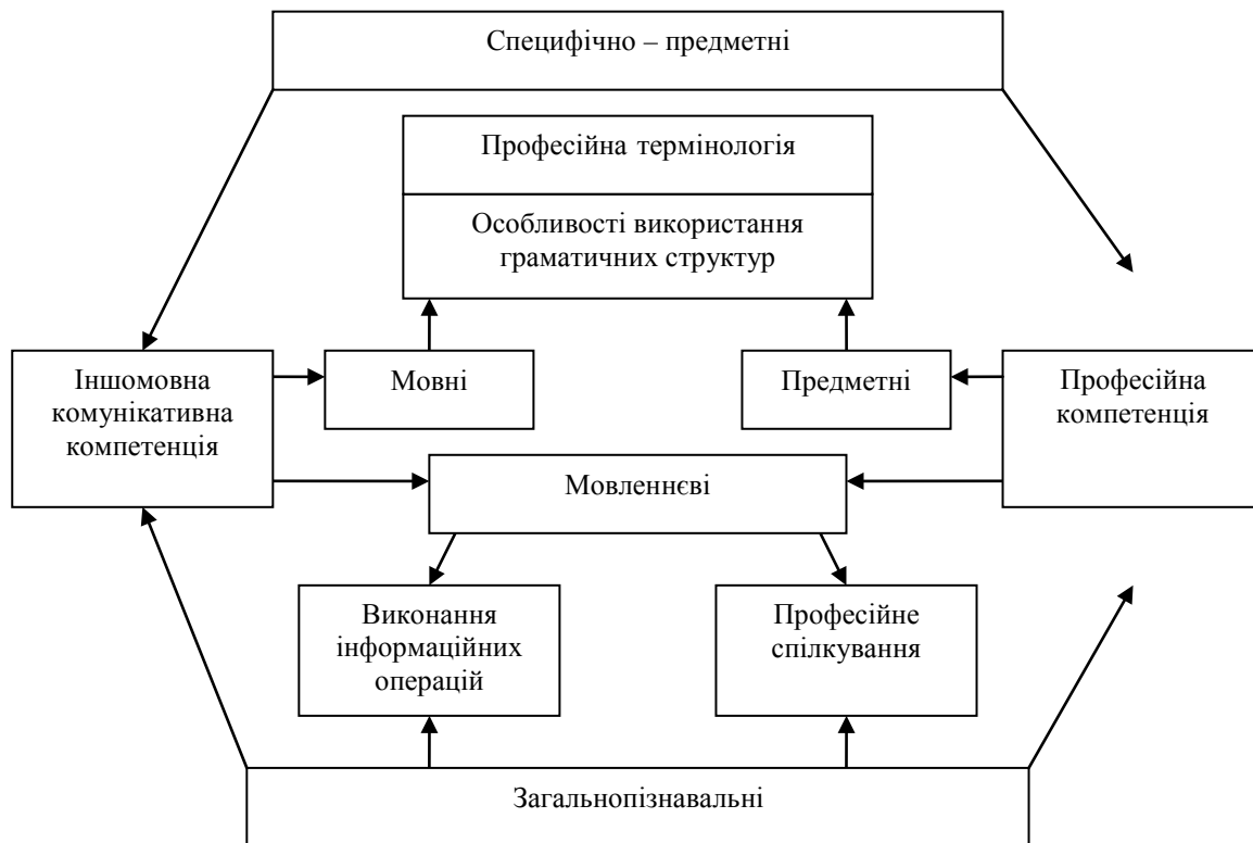
Рис. 1. Комплекс знань, умінь і навичок студентів економічних спеціальностей

У процесі вивчення іноземної мови студент має набути навичок визначення можливих джерел інформації, стратегію її пошуку, навичок аналізувати і оцінювати одержану професійно значущу інформацію з погляду на її точність, достатність у розв'язанні економічних проблем, використовувати результати пошуків, одержання і аналізу інформації для прийняття економічних рішень у подальшому діловому спілкуванні. Загальнопізнавальні уміння і навички: праця з першоджерелами, пошук необхідної інформації, систематизація і класифікація явищ, аналіз фактів, узагальнення і висновки, логічне мислення, коротке і стисле висловлювання своїх і чужих думок, аргументоване відстоювання своїх поглядів – є компонентами і професійної, і іншомовної комунікативної компетенції. Наше розуміння співвідношення знань, умінь, навичок студентів економічних спеціальностей, які мають формуватися в процесі самостійної роботи з іноземної мови, відображено на рис. 1.