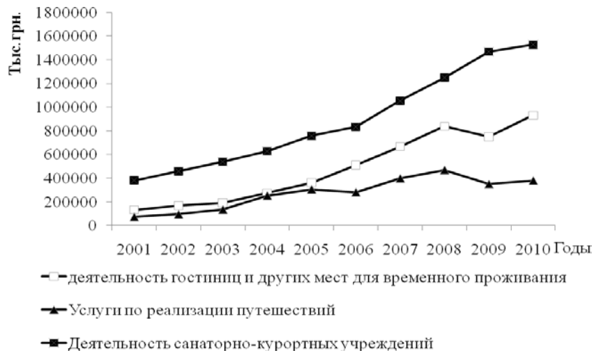
Рис. 2. Объем реализованных туристских услуг в АР Крым за 2001-2010 гг. [3]

Деятельность гостиниц и других мест для временного проживания 2003-2008 гг. стремительно увеличивалась, но в 2009 г. произошло снижение данной формы туристских услуг, что может быть связано с экономическим кризисом.