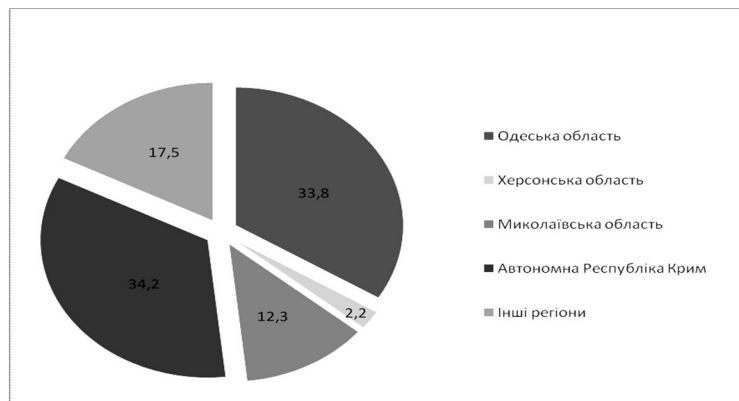
Рис. 3. Структура виробництва виноградних вин по регіонам України, %

якісною сировиною для підвищення конкурентоспроможності продукції та підприємства в цілому, що дасть можливість їм мати міцні конкурентні позиції на внутрішніх та зовнішніх ринках збуту.