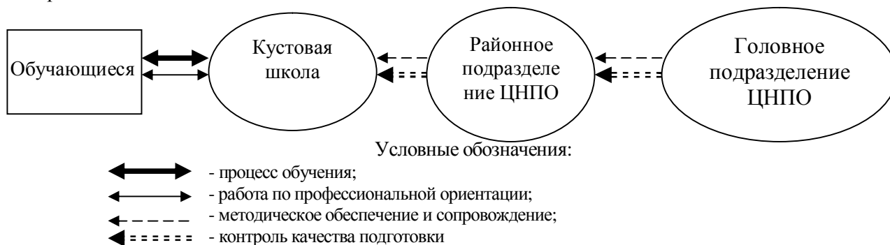
Рис. 2. Организация учебного процесса по общеобразовательной подготовке взрослого населения

Районные подразделения ЦНПО, кроме методического обеспечения и сопровождения процесса общеобразовательной подготовки с периодическим контролем качества знаний, должны вести работу по профессиональной ориентации обучающихся на базе кустовых школ. Профориентационная работа призвана помочь будущим абитуриентам в выборе специальности в соответствии с потребностями региональной экономики с целью их дальнейшей востребованности на рынке труда. Схема организации учебного процесса по общеобразовательной подготовке сельского населения приведена на рис. 2.