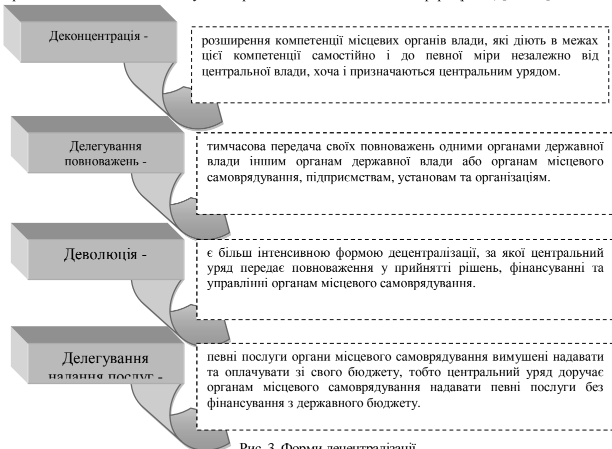
Рис. 3. Форми децентралізації

Тобто, можна з впевненістю стверджувати, що модель регіональної фінансової політики залежить від форми децентралізації, яка, у свою чергу, має забезпечувати баланс інтересів уряду та місцевих органів влади. Виходячи із змісту децентралізації, виділяють декілька її форм (рис. 3) [7, с.7-8].