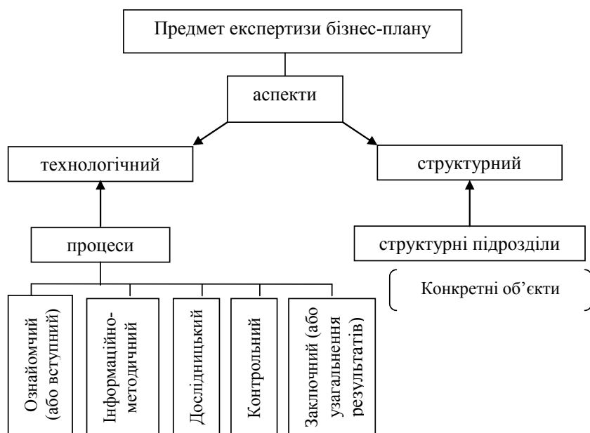
Рис. 1. Структура формування предмета експертизи бізнес-плану

До базових критеріїв оцінки предметів експертизи бізнес-плану повинні належати: наочність, повнота, достовірність і якість поданої інформації.