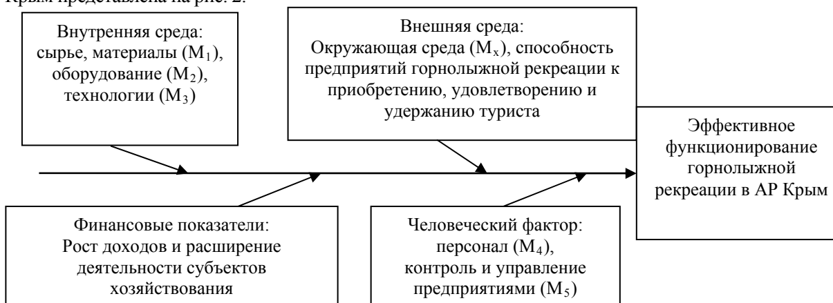
Рис. 2. Модель синтеза диаграммы Исикавы «5М» и системы сбалансированных показателей

На достижение эффективного функционирования горнолыжной рекреации в АР Крым влияет множество взаимозависимых факторов, которые, следуя методу диаграммы Исикавы «5М», можно объединить и распределить по уровням влияния на конечный результат. Графически диаграмма Исикавы «5М» с группированными факторами влияния на развитие горнолыжной рекреации в АР Крым представлена на рис. 2.