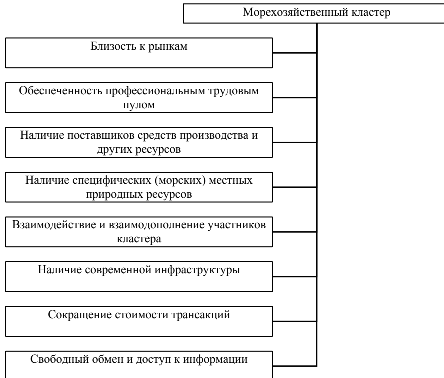
Рис. 2. Условия формирования и развития морехозяйственного кластера

Наличие природных ресурсов также является одним из важнейших факторов, благодаря которому возникают кластеры [11]. Велика роль морского природно-ресурсного потенциала, фактора размещения производительных сил, который включающего природные ресурсы и условия.