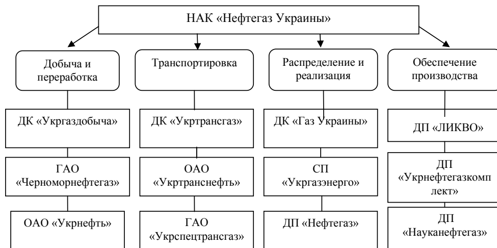
Рис. 1. Структура НАК «Нефтегаз Украины»

В состав НАК «Нефтегаз Украины» входят три дочерние компании (ДК), пять дочерних предприятий (ДП), два государственных акционерных общества (ГАО) и два открытых акционерных общества (ОАО) (рис. 1) [4].