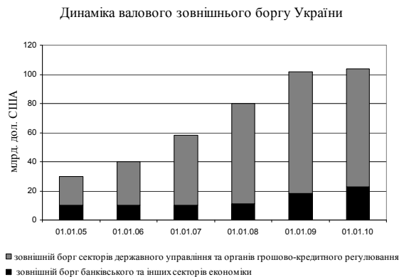
Рис. 1. Валовий зовнішній борг України

Проаналізуємо динаміку валового зовнішнього боргу України, що включає всі види заборгованості резидентів перед нерезидентами, які класифікуються за чотирма основними секторами економіки – сектор державного управління, органи грошово-кредитного регулювання, банки, інші сектори (заборгованість фізичних осіб, юридичних осіб та їх структурних підрозділів) (рис. 1) [6].