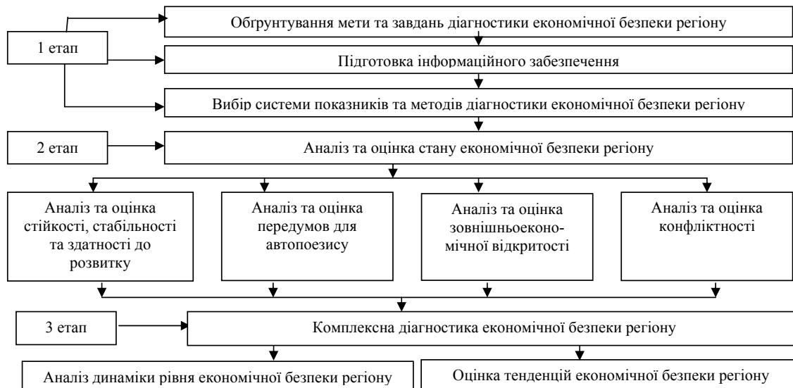
Рис. 1. Основні етапи діагностики економічної безпеки регіону

Методика діагностики економічної безпеки регіону повинна включати наступні етапи (рис. 1).