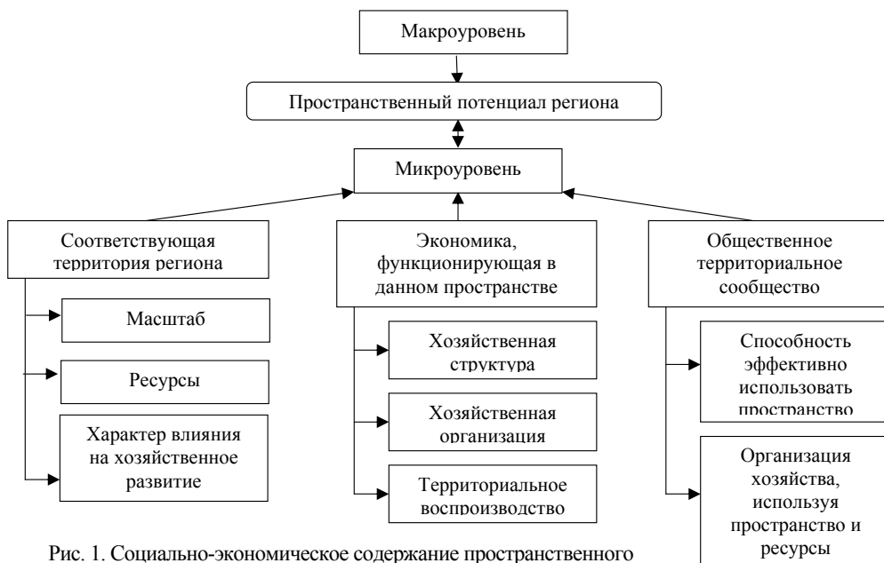
Рис. 1. Социально-экономическое содержание пространственного потенциала региона

Социально-экономическое содержание пространственного потенциала с точки зрения организации и использования территории включает три важнейшие составляющие, характеризующие жизнь и деятельность территориальных сообществ и определяющие возможности развития определенной территории (рис. 1).