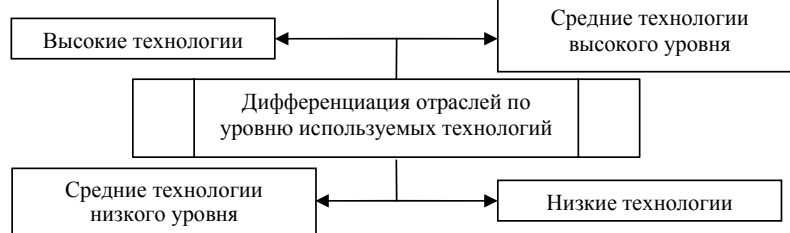
Рис. 2. Дифференциация отраслей по уровню используемых технологий по методологии ОЭСР

Предлагаем для исследования сгруппировать предприятия со сходными моделями инновационного поведения, например, по технологической сложности процессов производства. Для этого можно использовать методологию ОЭСР, которая выделяет четыре группы отраслей (рис. 2).