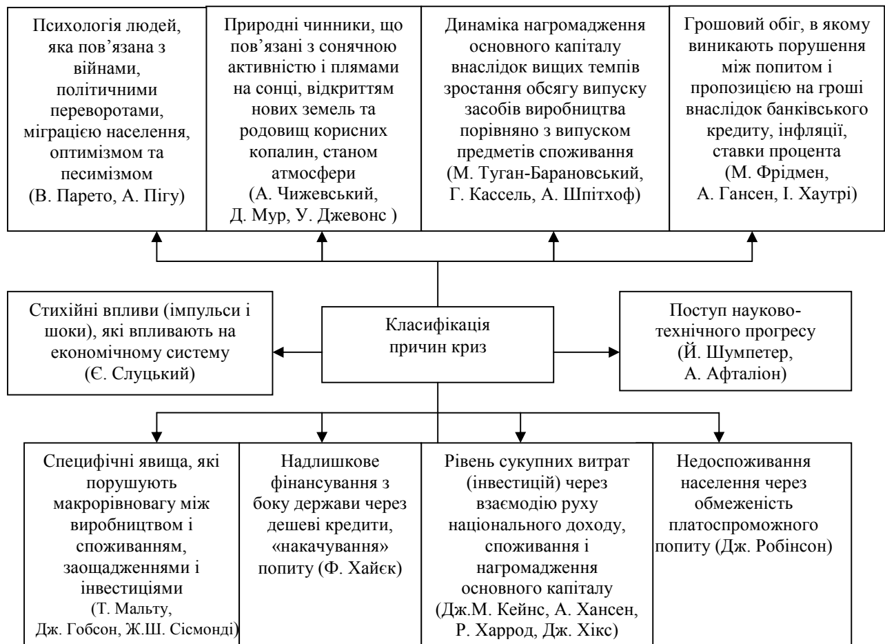
Рис. 2. Класифікація та характеристика причин криз

Особливої уваги та усвідомлення потребує той факт, що фази винаходів та нововведень мають тенденцію до прискорення. Тобто, починаючи від перших винаходів та їх втілення і наближуючись до нашого часу, чітко простежується скорочення розриву між винаходом і його втіленням у виробництво.