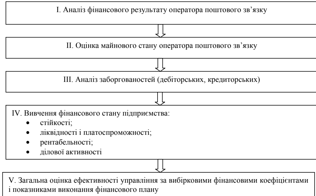
Рис. 2. Загальна схема поетапного моніторингу фінансово-господарської діяльності оператора поштового зв'язку

Також необхідним є визначення коливань доходів і витрат, фінансового результату.