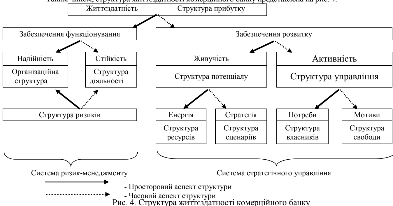
Рис. 4. Структура життєздатності комерційного банку

Таким чином, структура життєздатності комерційного банку представлена на рис. 4.