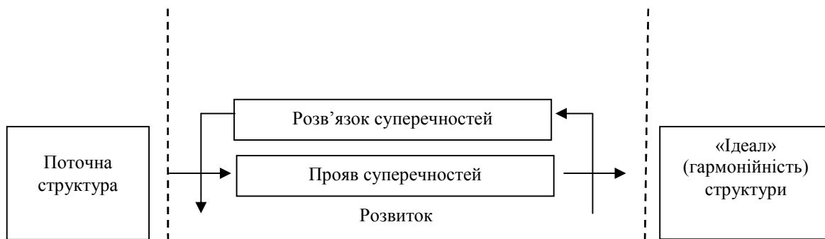
Рис. 1. Місце структури в забезпеченні розвитку соціально-економічної системи

З урахуванням вищевказаного, удосконалимо концепцію життєздатності соціально-економічної системи (рис. 2).