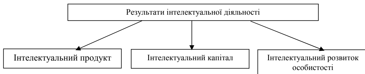
Рис. 2. Результати інтелектуальної діяльності як мотиваційний чинник трудової активності

Таким чином, творча праця окрім націленості на створення інтелектуальний продукту, несе в собі ще два важливих аспекти: у її процесі відбувається відтворення персоніфікованого інтелектуального капіталу та інтелектуальний розвиток особистості (рис. 2), які виступають важливими мотиваційними чинниками трудової діяльності [8, с. 47].