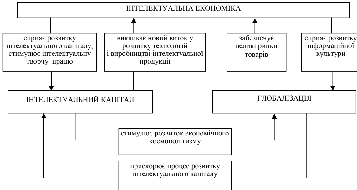
Рис. 1. Складова інтелектуальної економіки у системі взаємозв'язків основних світових тенденцій

те, що творча діяльність не може бути повторенням відомого, її результату завжди властива новизна, оригінальність.