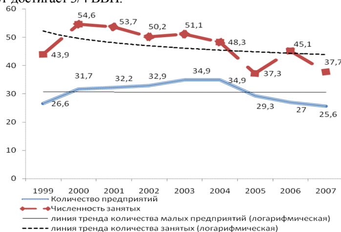
Рис. 1. Динамика удельного веса численности занятых и количества предприятий производства материальных продуктов малого бизнеса Курганской области, %

Отличительным признаком и особенностью сферы производства материальных услуг является ее меньшая зависимость от ресурсов, что благоприятствует развитию данной сферы и порождает производство новых видов товаров сервисного назначения, поскольку сокращение материало- и энергопотребления сопровождается одновременным увеличением добавленной стоимости и ростом валового продукта. Ресурсный потенциал сферы материальных услуг определяет экономическую значимость этой сферы в системе общественного воспроизводства. Достаточно сказать, что в настоящее время в ВВП развитых стран заметно снижается доля производства материальных продуктов и возрастает доля сферы услуг (материальных и нематериальных). В отдельных странах доля материальных услуг достигает 3/4 ВВП.