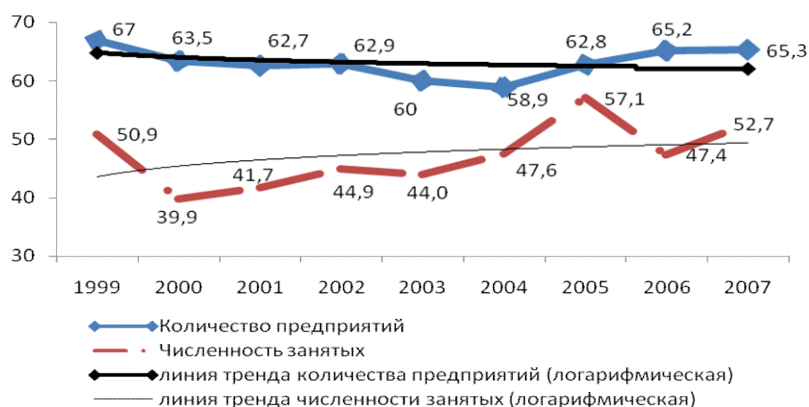
Рис. 2. Удельный вес численности занятых и числа малых предприятий производства материальных услуг, %

По состоянию на 1 января 2008г. более 65% (2/3 от общего числа) МП Курганской области также функционируют именно в сфере производства материальных услуг. За период 1999-2007гг. показатели удельного веса малых предприятий и численности работающих в них изменились незначительно: сократилось количество МП (главным образом, за счет торговли – с 42,2% в 1998г. до 34% в 2007 г.), несколько увеличился удельный вес численность работающих на МП данной сферы.