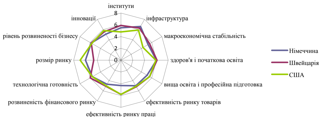
Рис. 1. Позиціонування постіндустріальних країн за індикаторами GCI, 2009-2010 рр.

Розглянемо конкурентні переваги національних економік провідних країн за соціально-економічними показниками (рис. 1).