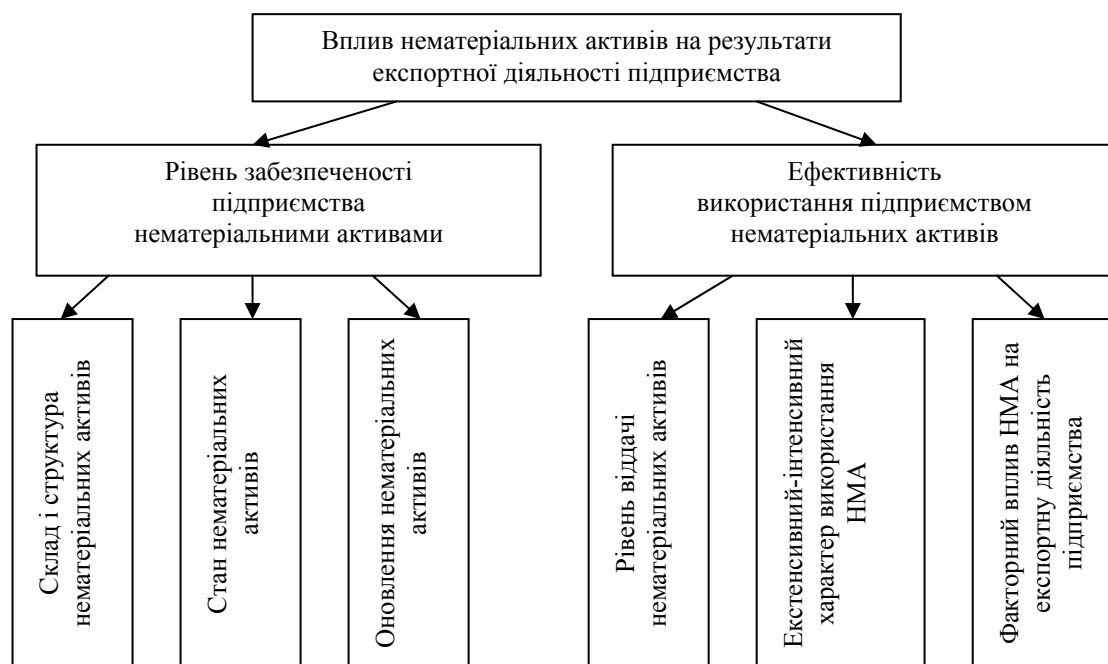
Рис. 3. Модель визначення впливу нематеріальних активів на результативність експортної діяльності підприємства, авторська розробка

Для здійснення оцінки і подальшого управління нематеріальними активами підприємства-експортера, на наш погляд, доцільно скористатися наступною моделлю визначення впливу нематеріальних активів на результативність експортної діяльності підприємства (рис. 3).