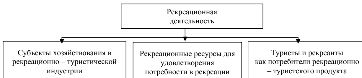
Рис. 1. Составные элементы рекреационной деятельности

Рынок рекреационных услуг АР Крым – это сложный объект, который может рассматриваться в рамках различных подходов: