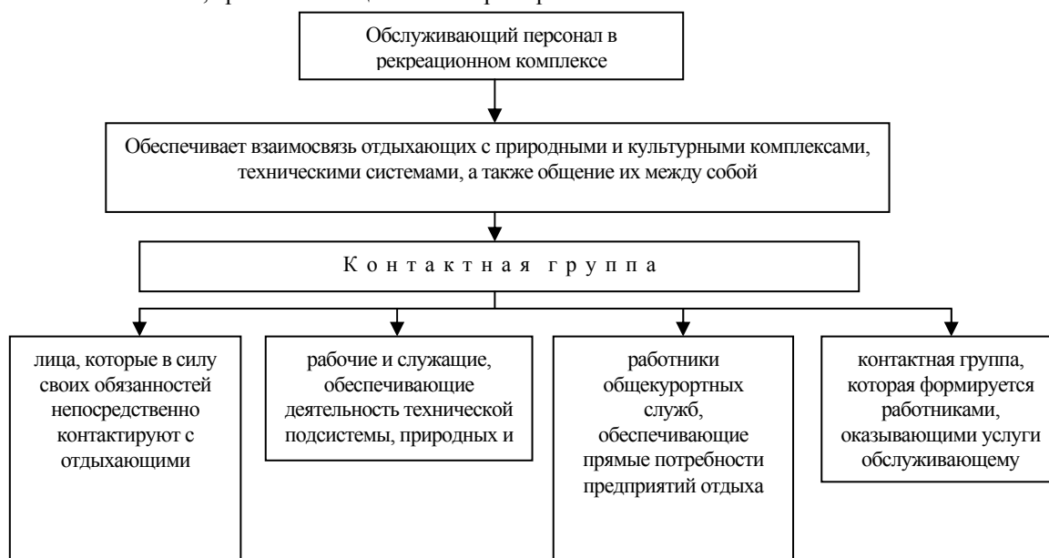
Рис. 1. Категории работников в рекреационном комплексе

В связи с этим важной экономической задачей является поиск путей подготовки специалистов этого профиля, которые могли бы ориентироваться во всей этой сложной взаимосвязи перечисленных выше составляющих и эффективно ими пользоваться.