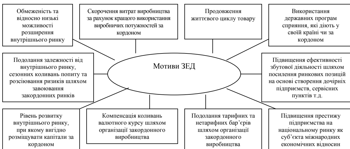
Рис. 1. Елементи мотиваційного механізму ЗЕД

Ухвалення рішення про вихід на зовнішній ринок і вибір певних форм міжнародного підприємництва повинні бути засновані на розробці цільової функції ЗЕД підприємства виходячи з аналізу внутрішніх можливостей і впливу зовнішніх чинників.