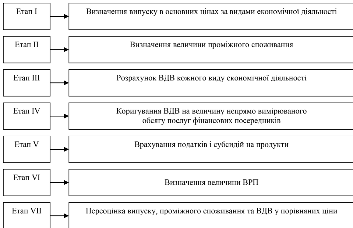
Рис. 1. Етапи розрахунку ВРП

На першому етапі розрахунку ВРП необхідно визначити вартість товарів і послуг, які є результатом виробничої діяльності господарюючих суб'єктів у звітному періоді.