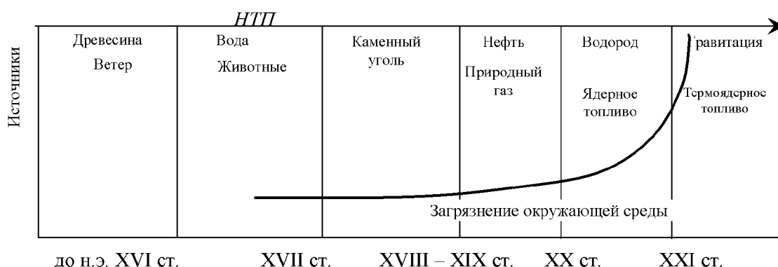
Рис. 1. Взаимосвязь энергетики, НТП и экологии

В XIX ст. по настоящее время в нарастающих масштабах кроме каменного угля используется нефть и природный газ, с середины XX ст. — ядерное топливо, водород. В XX ст. кривая развития НТП приобрела характер экспоненциальной функции. Это означает, что в XXI ст. будут, в основном, исчерпаны все ископаемые источники сырья и энергии, наступит глобальный экологический кризис. Энергетика в этом процессе играет ключевую роль. Из этого следует, что необходимо расширить применение известных альтернативных и поиск новых экологически чистых источников энергии (рис. 1) [2, с. 8].