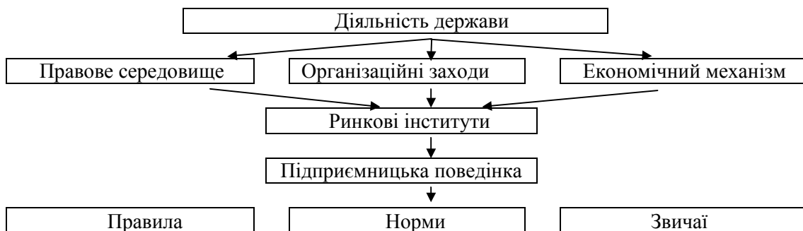
Рис. 2. Інституціональне забезпечення підприємництва

Стратегія держави щодо зміцнення інституціональних основ підприємництва має полягати у забезпеченні позитивних соціально-економічних структурних зрушень відтворювальних процесів. Інституціональне середовище визначається законодавчими, організаційними, економічними та етичними чинниками, які формують підприємницьку поведінку. Схематично інституціональне середовище підприємницької діяльності може зображатися таким чином (рис.2).